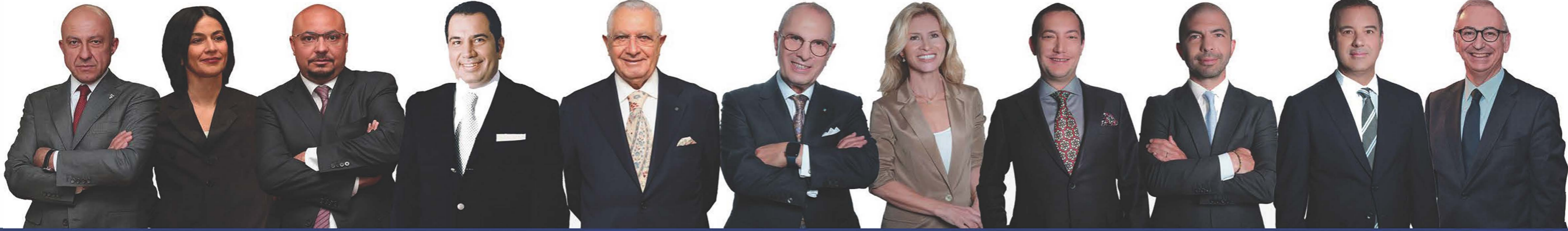
Av. Cumhuri Bozkurt Yönetim Kurulu Üyesi, Baş Hukuk Müşaviri